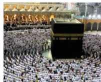
(Kaaba) em Mecca

No tempo de Jesus (que a paz esteja com ele), a direção para orar era para Jerusalém: (João 4:20-21) . Jesus disse que os verdadeiros adoradores, adorarão a Deus em "espírito e verdade": (João 4:23-24) , o que significa "eles serão sinceros em sua adoração", não significa que adorarão a Deus em alguma direção determinada . Jesus cuidadosamente seguia os profetas e rezava em direção ao Templo Sagrado.